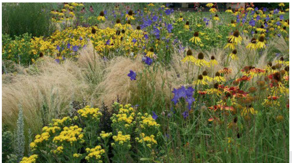
Bild 14: Nassella tenuissima in der Mischung "Weinheimer Präriemorgen".