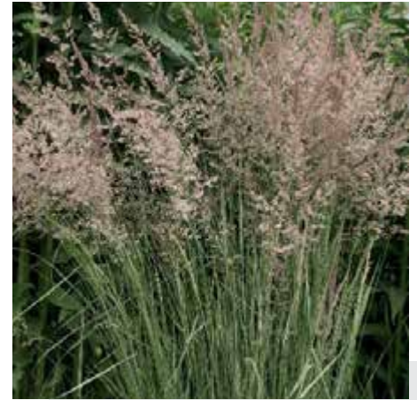
Bild 3: Calamagrostis x acutiflora 'Overdam' besitzt panaschiertes Laub.

verfärben sie sich später gelb-braun und sind im Herbst und Winter sehr attraktiv. Bevorzugt werden warme geschützte Standorte bei nicht zu schweren Böden. Eines der meist verbreiteten Ziergräser weltweit dürfte das Gartensandrohr Calamagrostis x acutiflora mit der Sorte 'Karl Förster' sein. Diese von Karl Förster ursprünglich als 'Stricta' eingeführte Sorte wurde nach seinem Tode ihm zu Ehren umbenannt. Entstanden ist es aus einer Kreuzung zweier heimischer Arten. Seine straff aufrecht wachsenden bis 1,80 m hohen Halme kommen ab Mitte Juni zur Blüte. Einzeln oder in Gruppen, als Ge-