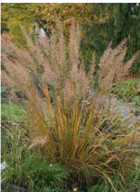
Bild 4: Das Diamantgras Calamagrostis arundinacea var. brachytricha .

Das in Japan und Korea beheimatete Diamantgras Calamagrostis brachytricha , mit komplettem Namen Calamagrostis arundinacea var. brachytricha , auch unter der älteren Bezeichnung Achnatherum brachytrichum im Handel, wird ungerechtfertigterweise eher selten verwendet. Als Akzentpflanze ist es durchaus reizvoll mit seinen z.T. überhängenden Rispen, die ab Juli ausgebildet werden. Zunächst leicht rosa getönt