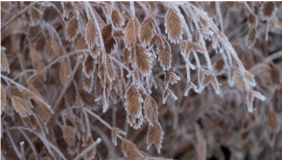
Bild 7: Raureif verzaubert die Blütenstände von Chasmanthium latifolium .