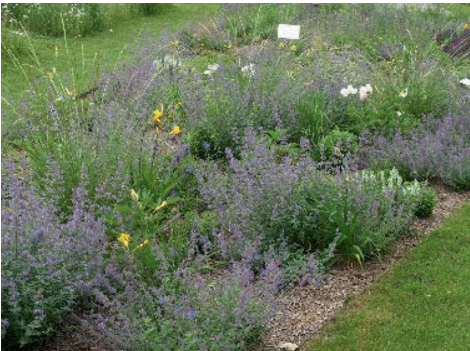
Bild 11: In der Staudenmischung „Blütenzauber“ hat der Atlasschwengel Festuca mairei im Frühsommer seinen festen Platz.

auch als klassischer Rosenbegleiter geführt wird. Vor allem die rostresistenten Sorten 'Robust' oder 'Saphirsprudel' mit ihren ca. 1,20 m hohen Blütenständen sind hier hervorzuheben.