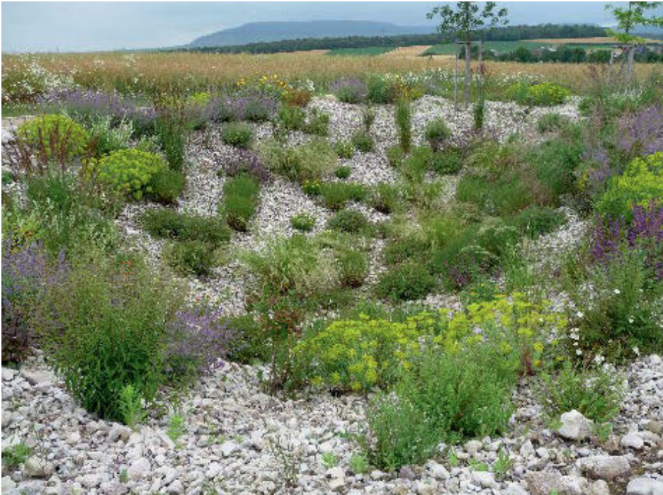
Bild 10: Das Überlaufbecken des Muldenversickerungssystems in der Gemeinde Willanzheim bietet viel Platz für Gräser. Im Bild Stipa calamagrostis 'Algäu' und Calamagrostis x acutiflora 'Karl Förster' mit zahlreichen sommerblühenden Stauden.