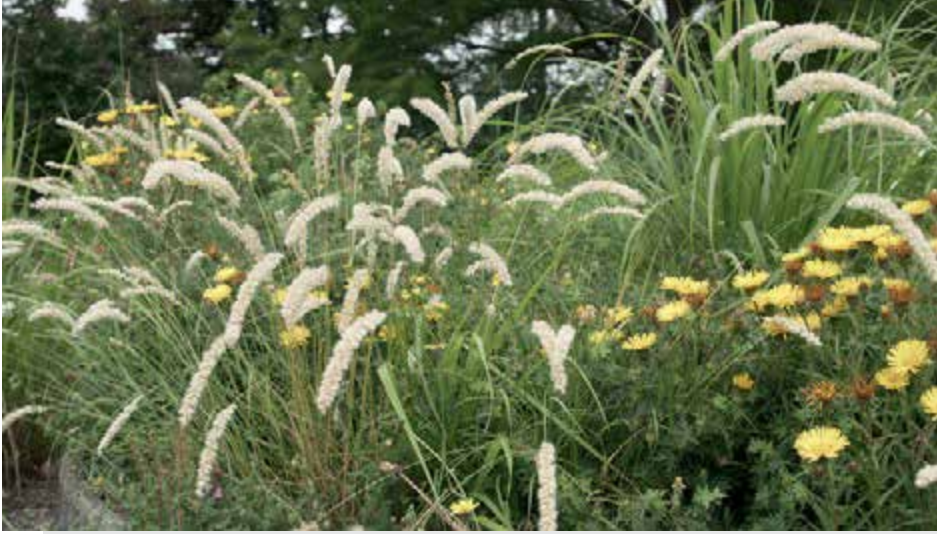
Bild 15: Das Wimper-Perlgras Melica ciliata ist besonders für sehr trockene Standorte geeignet.

violetten und roten Asten verwirklichen. Zu beachten ist die Standortvorliebe beider Arten. Sie benötigen einen warmen, eher trockenen, durchlässigen, sandig bis steinigen Boden. Empfehlenswert sind sie für Heide-, Steppen-, Kies- und Schottergärten, in Rosenbeeten sind sie keine idealen Partner. Besonders die Sorten des Blau-Schwingels Festuca cinerea sind aufgrund ihrer Anfälligkeit gegen Winternässe und Schneedruck oft kurzlebig. Zuverlässige und empfehlenswerte Sor-