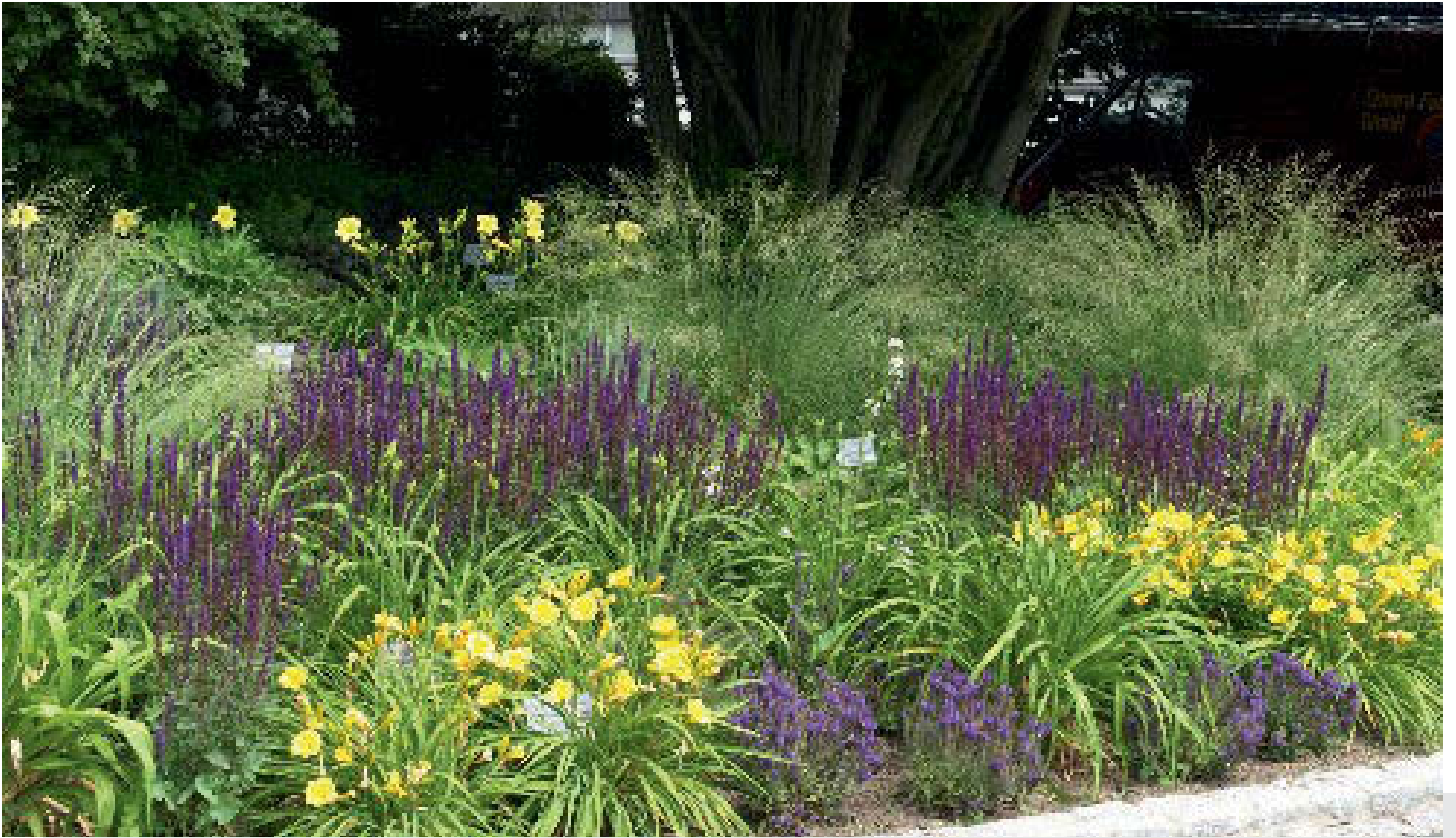
Bild 9: Das Afrikanische Liebesgras Eragrostis curvula kommt am besten mit sommerblühenden Stauden zur Geltung.

filigranen Blütenstände, in den Herbstmonaten entfalten die Gräser ihre volle Schönheit, indem sie sich goldgelb verfärben und ähnlich der Rutenhirse mit herbstblühenden Stauden prachvolle Kontraste bilden. Wenn die hohen Sorten nicht unter einer Schneedecke umknicken, hält der Aspekt bis weit in den Winter hinein an.