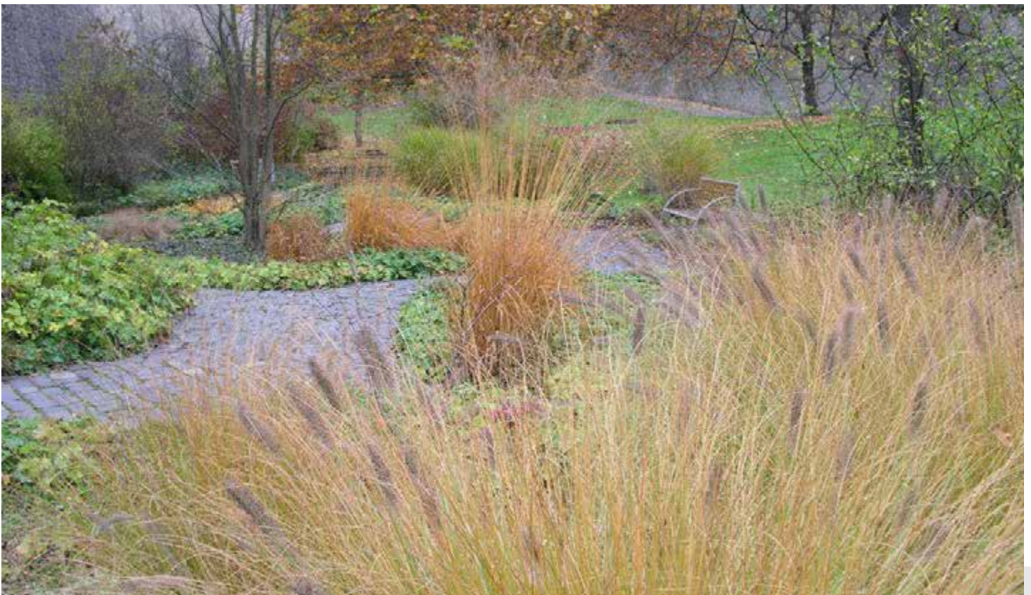
Bild 1: Besonders in den Herbstmonaten geben Gräser einer Pflanzung Farbe und Struktur.

Die Verwendung von Gräsern in Gärten verzeichnet in den letzten Jahren einen deutlichen Aufschwung. Das Potential der im Sortiment verfügbaren Grasarten wird jedoch immer noch zu wenig ausgeschöpft. Unter Beachtung der Standortvoraussetzungen können durch den gezielten Einsatz großer Solitärstauden bzw. bei flächiger Verwendung farbintensiver Arten, spektakuläre Effekte erzielt werden. Besonders in den Herbst- und Wintermonaten entfalten viele Arten ihre gestalterischen Höhepunkte, wenn die meisten Stauden und Sträucher keine besondere Kulisse mehr bieten. Hochwüchsige Arten und Sorten überzeugen durch ihre Wuchsform, ihre besondere Blütenstruktur, ihre Laubfarbe oder generell im Herbst durch außergewöhnliche Farbenspiele. Dabei ergeben sich bei Raureif oder Schnee oft faszinierende Bilder. Intensive Laubfarben findet man an sonnigen Standorten nicht nur im Herbst, auch ganzjährig reicht die Farbpalette von Gelb über Rot, Purpur, Kupfer und Bronze bis hin zu Stahlblau. Im Artikel werden auch weniger bekannte Arten vorgestellt. Besonderer Wert wird hierbei auch auf deren aktuelle Einordnung hinsichtlich der Nomenklatur gelegt.