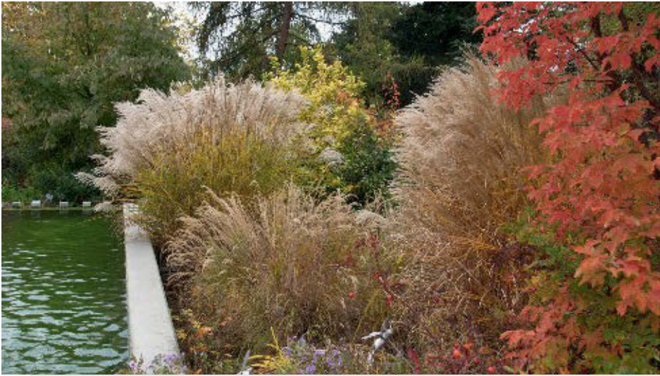
Bild 6: Das Chinaschilf Miscanthus wirkt besonders im Sommer und Herbst.