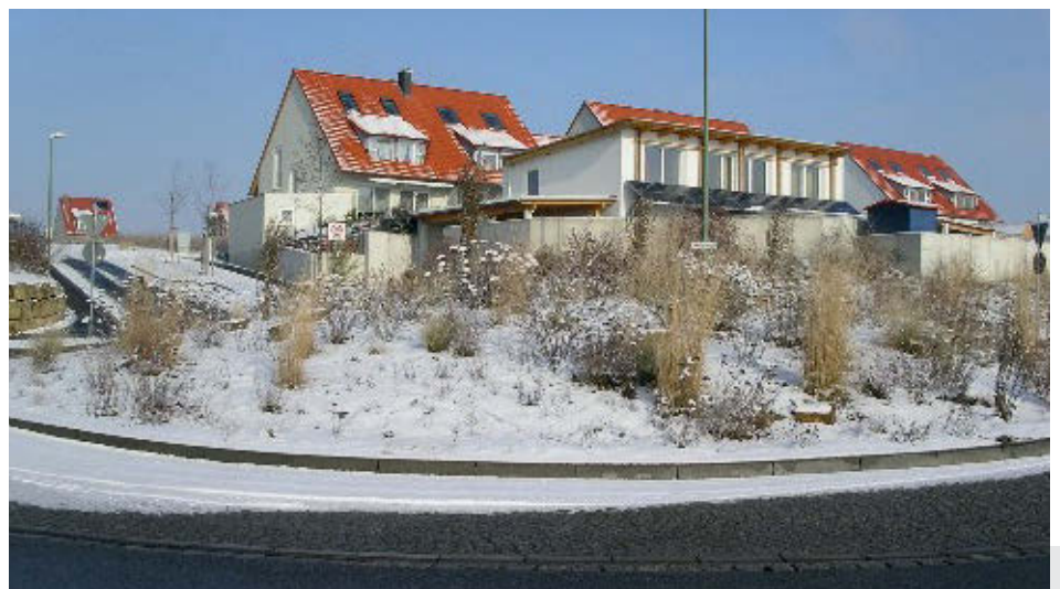
Bild 5: Auch im öffentlichen Grün dürfen Gräser, wie hier das Gartensandrohr, nicht fehlen.

rütbildner platziert, wirkt dieser Klassiker in seiner typischen Wuchsform über die Herbst- und Wintermonate. Hinsichtlich Boden- und Feuchtigkeitsansprüchen ist es sehr anpassungsfähig. Toleriert werden alle mäßig trockenen bis frischen Gartenböden. Mit der Sorte 'Overdam' steht dem Pflanzenverwender eine mit 1,50 m etwas niedrigere panaschierte Form zur Verfügung. Ihre schmalen Blätter sind fein weiß gerandet, die Blüten rosa überhaucht. Werden die Horste nach der Blüte zurück geschnitten, kommt die Panaschierung beim erneuten Austrieb noch besser zur Geltung.