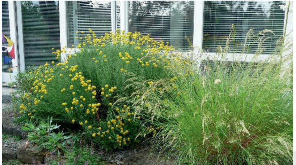
Bild 12: Stipa calamagrostis 'Algäu' mit Santolina rosmarinifolia .

Die blaulaubigen Vertreter der Gattung Festuca mit ihren Sorten der Arten F. ovina und F. cinerea sind hier sehr beliebt. Alle bisher unter F. glauca geführten Sorten werden inzwischen überwiegend Festuca cinerea zugeordnet, die Art selbst ist kaum im Handel. Wirkungsvolle Kombinationen lassen sich z.B. mit rotblühenden Sedum -Arten oder auch mit