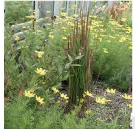
Bild 17: Imperata cylindrica 'Red Baron' mit Coreopsis verticillata .

Die meisten vorgestellten Gräser sind langlebig und brauchen nur ein Minimum an Pflege. Der beste Pflanztermin ist das zeitige Frühjahr, wenn der Boden sich bereits erwärmt hat. Dann sind die Bedingungen optimal, um neue Wurzeln zu bilden. Im Herbst wachsen Gräser oft schlecht an und es kommt eher zu Ausfällen. Entsprechend der Gräserauswahl sollte der Boden vor der Pflanzung vorbereitet werden. Steppengräser benötigen einen gut durchlüfteten, nicht zu nährstoffreichen Boden mit guter Wasserdurchlässigkeit. Bei schweren Böden empfiehlt sich die Einarbeitung von Sand oder Splitt. Zu viele Nährstoffe können die Standfestigkeit beeinträchtigen. Erst im zeitigen Frühjahr sind Rückschnittmaßnahmen angesagt, um die volle Wirkung während der Wintermonate auszuschöpfen. Alle sommergrünen und wintergrünen Gräser sollten bis auf den Boden zurückgeschnitten werden. Der Zeitpunkt ist entsprechend rechtzeitig zu wählen, bevor der Neuaustrieb einsetzt. Greift man bei der Auswahl der Gräser auf bewährte Arten und Sorten mit guten Sichtungsergebnissen zurück und