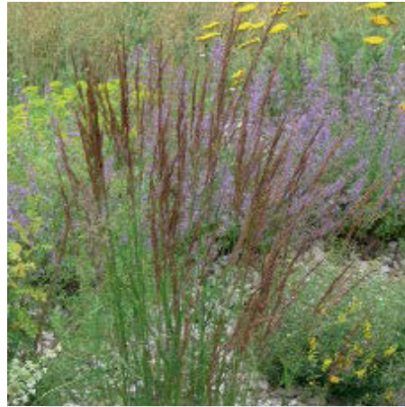
Bild 2: Das Gartensandrohr Calamagrostis acutiflora 'Karl Förster'.