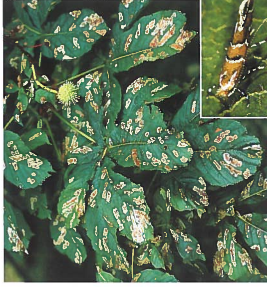
Schadbild und Kastanien-Miniermotte

Im Jahr 1984 wurde in Mazedonien ein Kleinschmetterling entdeckt, dessen Larven in den Blättern von Rosskastanien leben. Die als neue Art Cameraria ohridella beschriebene Rosskastanien-Miniermotte verbreitete sich in den folgenden Jahren explosionsartig in Mittel- und Westeuropa. In Deutschland wurde dieser Schädling erstmals 1993 entdeckt. Als Folge des Larvenfraßes in den Blättern verbräunen diese bei starkem Befall schon im Sommer und werden oft vorzeitig abgeworfen. Dieses Fallblatt informiert über die Lebensweise des neuen Kastanien Schädlings, den Schaden und mögliche Gegenmaßnahmen.