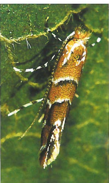
8. Fertig entwickelte Roskastanien-Miniermotte in natürlicher Haltung auf einem Kastanienblatt. Die Motte ist bis zu 5 mm lang bei einer Flügelspannweite von etwa 7 mm.