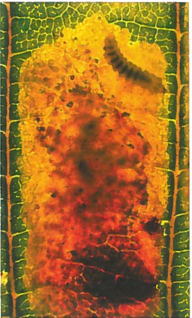
2. Zwischen den Blattadern ausgerichtete Platzmine als Folge des Larvenfraßes. Aufnahme im Durchlicht mit Larve (oben links) und Kokonröhren. Zur Diagnose Blätter gegen das Licht halten.