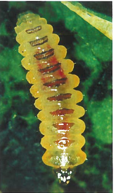
3. Altlarve (bis 5 mm Länge) nach geöffneter Platzmine mit stark eingeschnürten Segmentgrenzen und Rückenplättchen. Der Körperbau ist abgeflacht und so an die Lebensweise im Blattinneren angepasst.