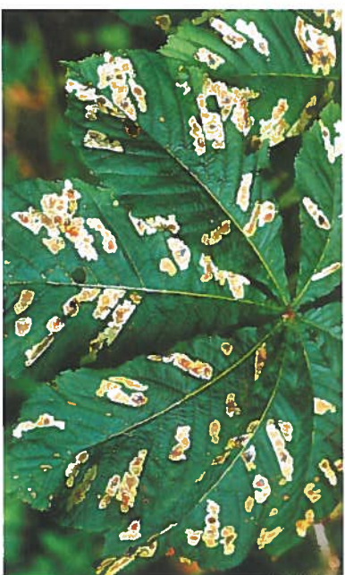
4. Charakteristische Blattschäden durch die Roskastanien-Miniermotte. Der Larvenfraß im Blattinneren (vgl. Abb. 2) führt zu Platzminen, die in jungem Zustand im Randbereich hellbeige oder grünlich gefärbt sind.

In Deutschland entwickelt die Roskastanien-Miniermotte in Abhängigkeit von der Witterung meist drei Generationen im Jahr. Im Frühjahr schlüpfen die Falter (8) der im Falllaub überwinterten Generation und fliegen etwa drei Wochen. Man findet sie dann häufig auf den windabgewandten sonnigen Stammarten und auf der Blattoberseite im unteren Kronenbereich der Kastanien. Die weiblichen Mothen legen durchschnittlich 30 Eier einzeln auf der Blattoberseite an schwächeren Seitenadern ab. Nach etwa zwei Wochen schlüpfen die Junglarven aus den Eiern (1) und minieren (2) ungefähr drei Wochen. Sie durchlaufen dabei vier Larvenstadien bis zur Altlarve (3) und verursachen die charakteristischen Schäden in den Kastanienblättern (4, 5), bevor sie sich verpuppen. Nach einer Puppenruhe von zwei bis drei Wochen schlüpfen die neuen Falter aus den Minen auf der Blattoberseite. Bei den Sommergenerationen fehlt der Puppenkokon häufig, während er bei der überwinterten Herbstgeneration obligatorisch ist (6, 7).