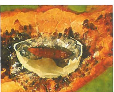
6. Verpuppungskokon zur Überwinterung mit geschlossener und geöffneter Seidenhaut und innenliegender Puppe nach Enternung der obersten Blattschicht (Epidermis). Durch den Kot der Larve ist der Minenboden schwarz gefleckt.