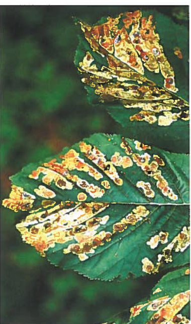
5. Ältere, im Randbereich der Blätter oft zusammenfließende Platzminen sind überwiegend bräunlich gefärbt.