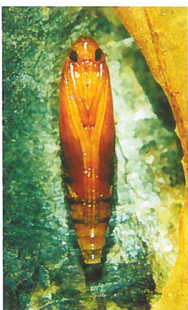
7. Im Kokon frei liegende hellbraune, walzenförmige, 3-5 mm lange Puppe der Roskastanien-Miniermotte. Der Kokonboden ist mit einem weißlichem Gespinnst ausgekleidet (vgl. Abb. 6, rechtes Bild).