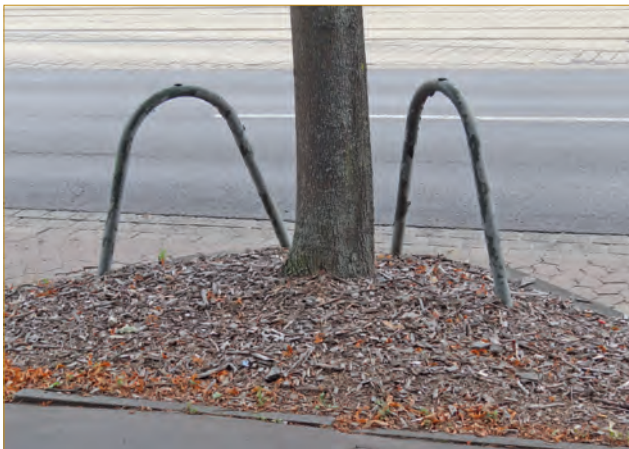
Abb. 8: Baumbügel können schäden an Wurzeln und Stamm verhindern