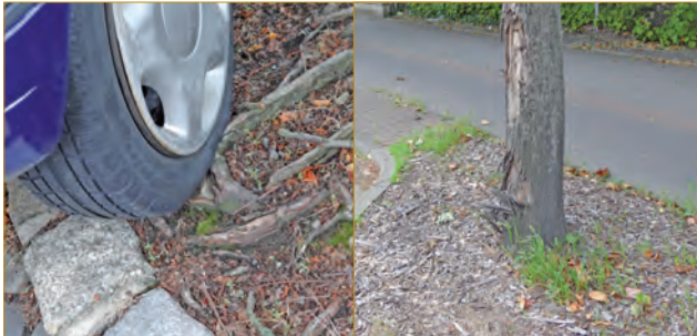
Abb. 6 - 7: Wurzelverletzungen und Stammschäden sind Eintrittspforten für Pilzsporen