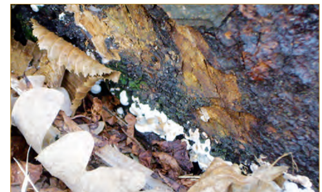
Abb. 4: Helle Fruchtkörper der Nebenfruchtform tief am Stammfuß