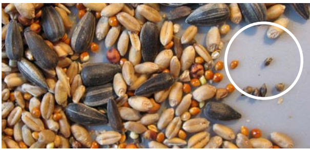
Mit Ambrosiasamen verunreinigtes Vogelfutter