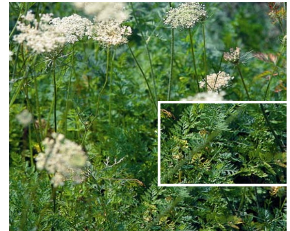
Wilde Möhre ( Daucus carota )