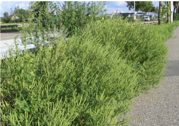
Größerer Bestand der Beifuß-Ambrosie an einer Bundesstraße bei Mannheim

Um der Ausbreitung der Pflanzen entgegen zu wirken, wird die Bevölkerung um Mithilfe gebeten.