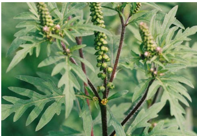
Beifuß-Ambrosie zu Beginn der Blüte mit deutlich rötlichen, behaarten Stängeln