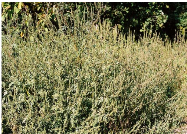
Größerer Bestand blühender Beifuß-Ambrosien

Die Pflanze wächst vorzugsweise auf gestörten offenen Böden, z. B. an Straßenrändern, in Neubaugebieten oder auf Schutthalden. In privaten Gärten findet man sie vor allem unter Vogelfutterplätzen, denn Vogelfutter kann mit Ambrosiasamen verunreinigt sein.