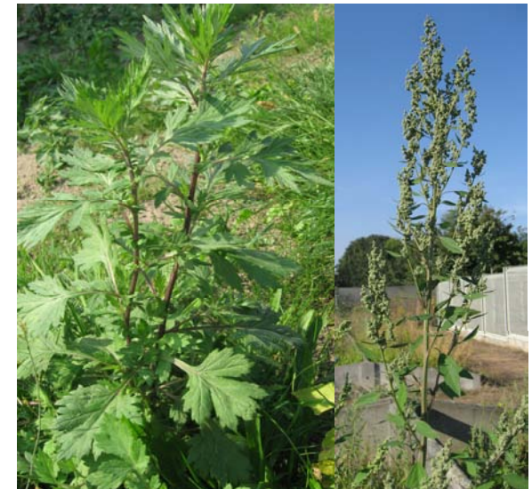
Links: Gemeiner Beifuß ( Artemisia vulgaris ) Rechts: Gänsefuß ( Chenopodium sp.)

Wegen ihrer unscheinbaren Blüten wird die Pflanze leicht übersehen. Sie kann mit anderen Arten verwechselt werden, z. B. mit dem Gemeinen Beifuß ( Artemisia vulgaris ), aber auch mit der Wilden Möhre ( Daucus carota ) und Gänsefuß-Arten ( Chenopodium sp.).