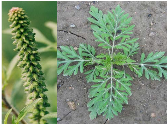
Männlicher Blütenstand der Beifuß-Ambrosie (links) Junge Pflanze mit typischen doppelt fiederteiligen Blättern (rechts)

Charakteristisch für die Beifuß-Ambrosie sind