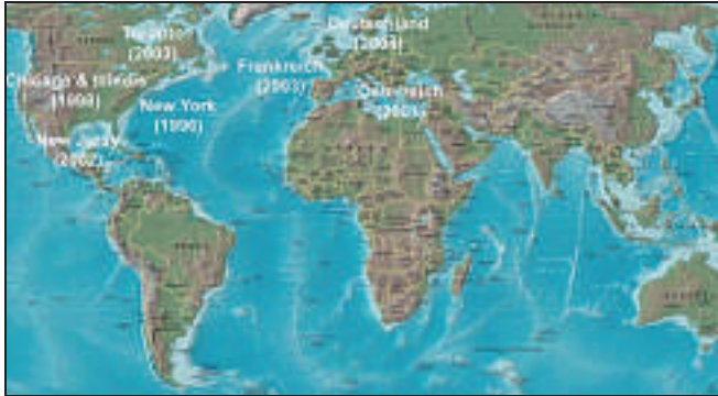
12. Jahr der Erstfunde des ALB unter Freilandbedingungen außerhalb seines Heimatgebietes in Asien

Heimat: Asien mit China, Korea, Taiwan, Literaturberichte über das Vorkommen in Japan sind nicht bestätigt.