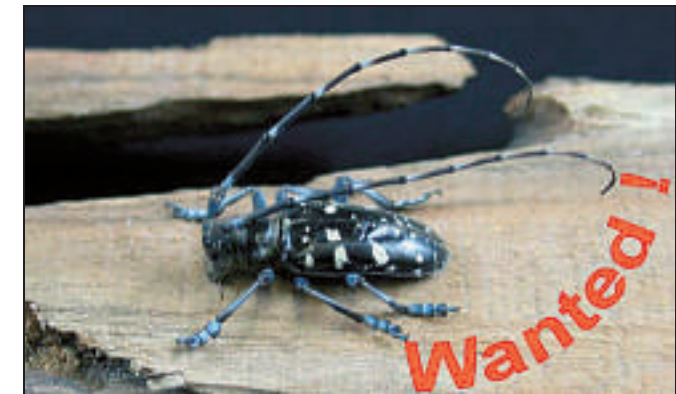
Männchen des Asiatischen Laubholzbockkäfers

Der Asiatische Laubholzbockkäfer (ALB) wurde aus seiner Heimat bereits in die USA sowie nach Österreich, Kanada und Frankreich verschleppt. In Deutschland wurde er erstmals im Jahre 2004 in der Nähe von Passau und in 2005 nahe Bonn festgestellt.